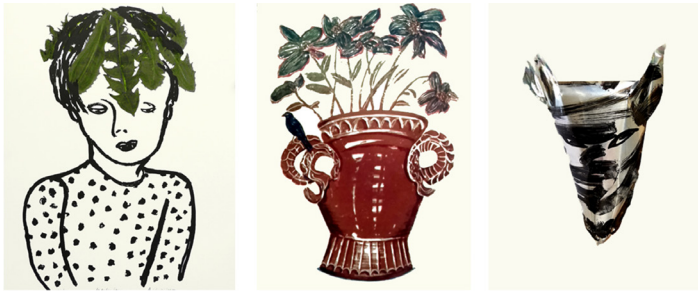
Maskrosbarn 50x40 cm, Den blå fågeln 58x40 cm, serigrafier. Varg 30x18 cm, tusch på aluminium.

Jag är född och uppvuxen i Västerås och flyttade till Hjo 1978 för att återvända till min hemstad 2019.